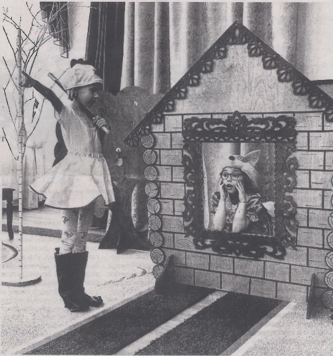
Выступление юных актеров группы «Птичка»

27 марта отмечается Всемирный день театра